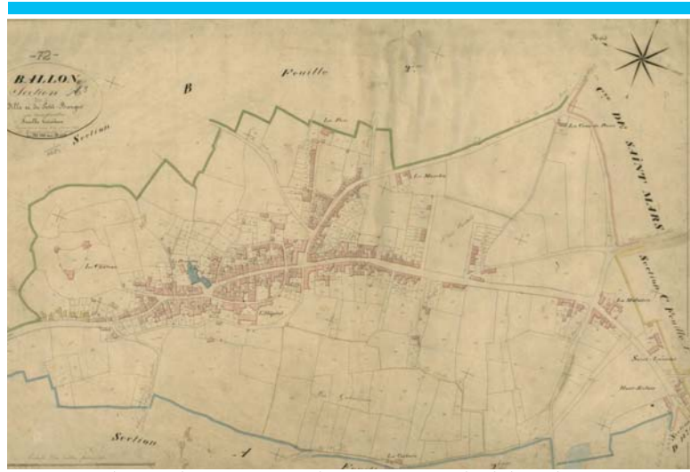
Plan Napoléonien 1836

Le château de Ballon est situé sur un éperon rocheux à la pointe d'un plateau dominant le Saosnois. Placée entre Maine et Normandie, la forteresse fut l'enjeu de nombreuses batailles.