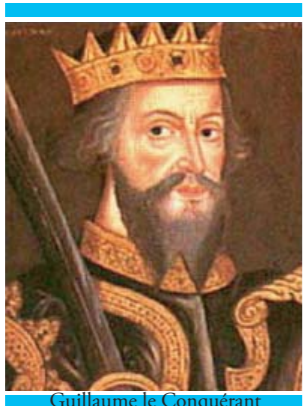
Guillaume le Conquérant