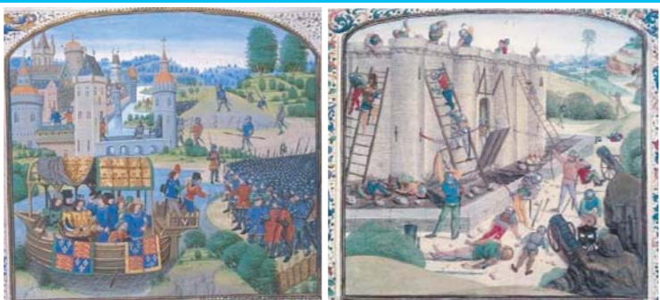
Illustrations de la Bibliothèque Nationale de France, tirées d'une version du XVè s. des "grandes chroniques de France"

Pendant la guerre de Cent Ans, la forteresse dut subir un certain nombre de sièges.